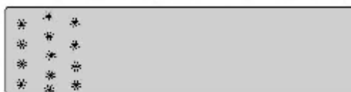
Breit- oder Wurfssaat