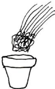
1. Schnittlauch aus dem Topf nehmen.