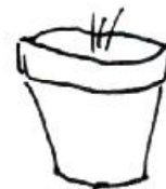
3. Topf mit nährstoffreicher Erde füllen und 2-3 Zwiebeln einpflanzen: In 2 Wochen ist der Lauch wieder erntereif und die Zwiebeln verkehren sich.